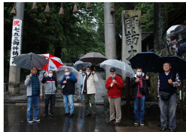
雨の諏訪大社 老人会のご一行かな?

中央道も交通量も少なく双葉SAで朝食(8時)を済ませて諏訪ICから下道で諏訪大社(下社、上社)を雨の中で参拝し、新島々あたりで雨は上がり沢渡で昼食。この程度の雨ならバイクで行けました。。。。。。。