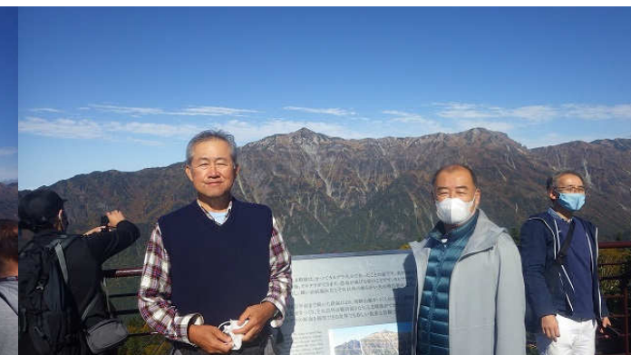
新穂高ロープウェイ山頂